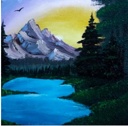
Pictură realizată de Ardeleanu Larisa, clasa a XI-a E