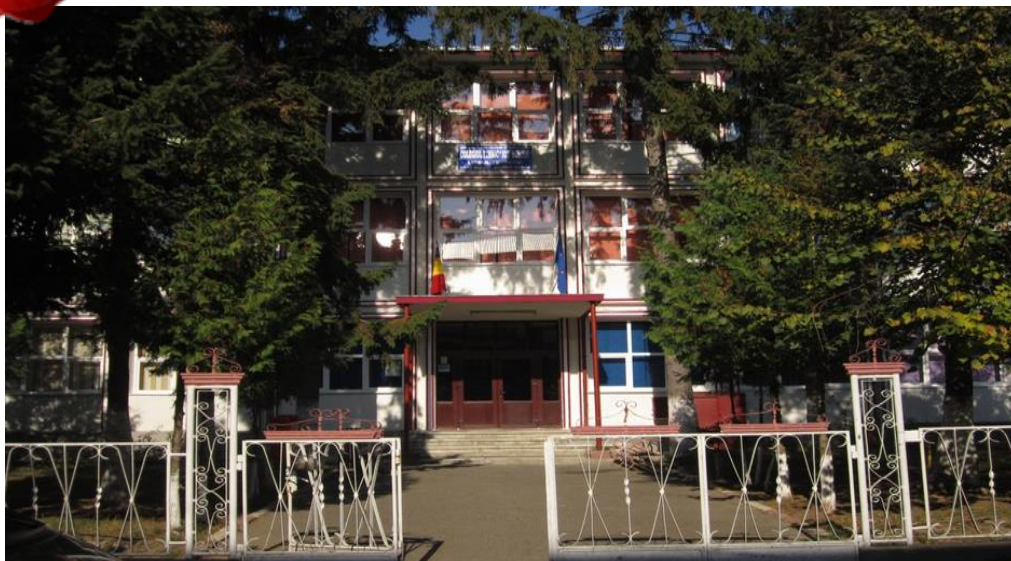
Foto sus: Colegiul Tehnic „Ion Borcea” Buhuși, corpul A Foto jos: Colegiul Tehnic „Ion Borcea” Buhuși, corpul B