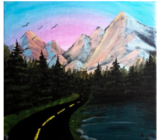
Pictură realizată de Ardeleanu Larisa, clasa a XI-a E