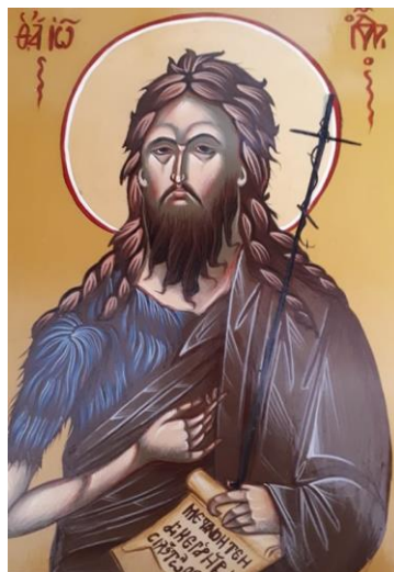
Pictură realizată de Alexandru Rugină, clasa a VI-a

« L'hiver est merveilleux ! » s'écrie un gamin En plongeant dans la neige ; Dans le jardin, les perce-neige Maudissent l'hiver chafouin Et rêvent du beau printemps !