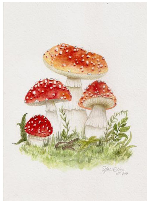
Pictură realizată de Elisabetta Diac, clasa a X-a A